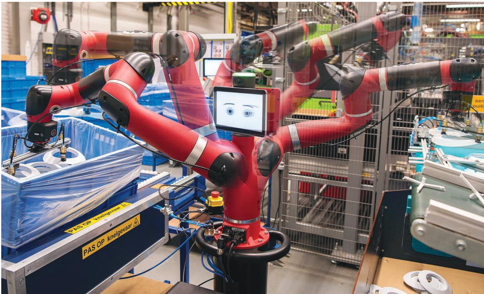
Bij Ubbink, dat producten maakt voor de installatie en bouw, werken cobots; robots die náást je werken.

noemen.' QRM staat voor Quick Response Manufacturing , een strategie die helpt met het verbeteren van processen in zowel de productie als op kantoor. Kaak past dat als volgt toe: 'We proberen veel eigenaarschap te krijgen bij onze medewerkers. Hierdoor pak je alles als team beter aan en lever je dus betere kwaliteit.' Om de aanpak dui-